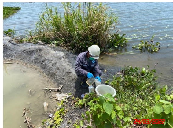
แม่น้ำแม่กลอง