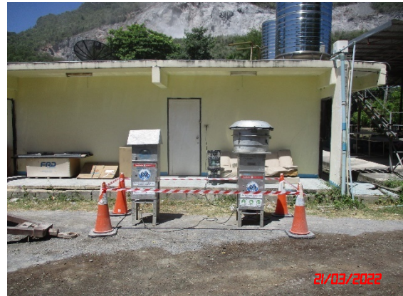
สำนักงานโรงโม่หินศิลาเขาน้อย