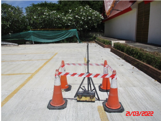
วัดบ้านถ้ำ