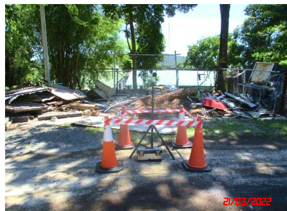
สำนักงานโรงโม่หินศิลาเขาน้อย