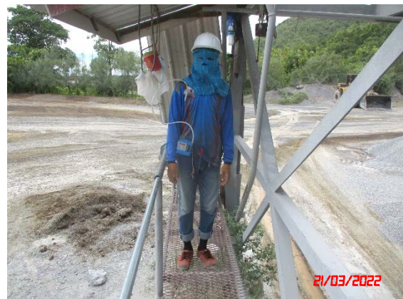
พนักงานของโครงการ คนที่ 2