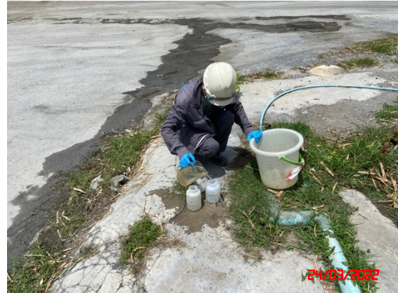
บ่อบาดาลบริเวณโรงโม่หินศิลาเขาน้อย