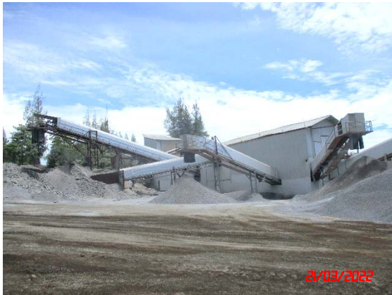
อาคารปิดคลุมโรงโม่หิน