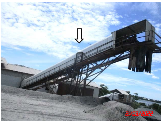
หลังคาปิดคลุมสายพานลำเลียง