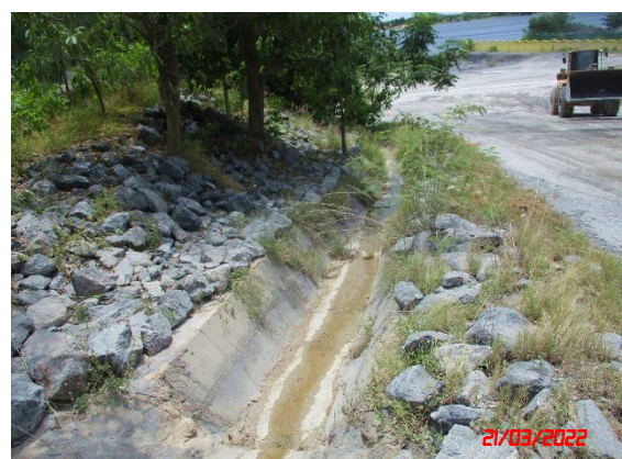
คูระบายน้ำ