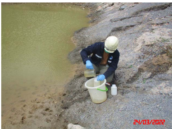
น้ำบ่อดักตะกอนของโครงการ