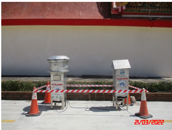
วัดบ้านลำ