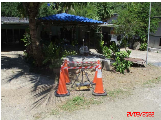
บ้านหลังที่ไกลสุดด้านทิศเหนือ