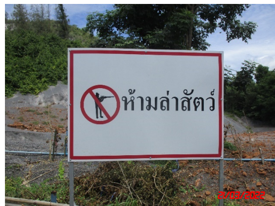
ป้ายเตือนห้ามล่าสัตว์