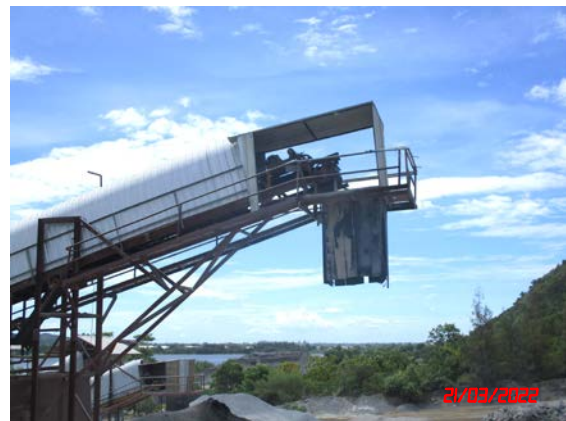
อุ้งครอบปลายสายพานลำเลียง