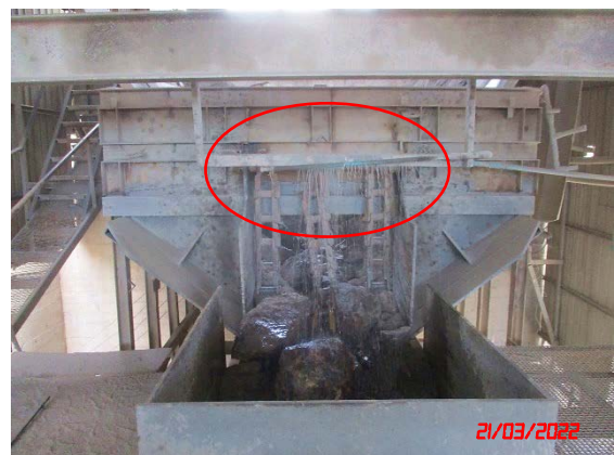
ระบบสเปรย์น้ำยู่รับหินใหญ่