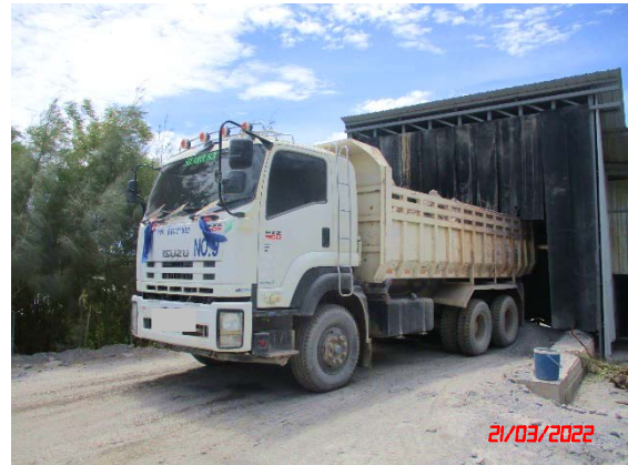
อาคารปิดคลุมยู่รับหินใหญ่