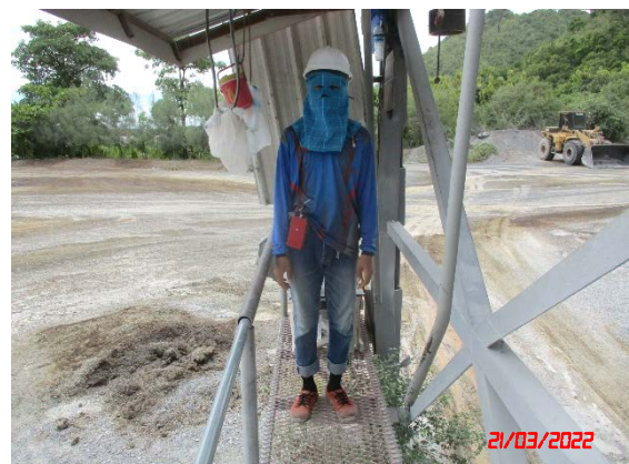
พนักงานของโครงการ คนที่ 2