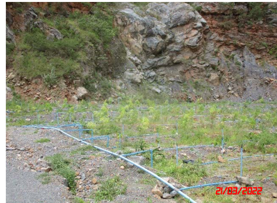
รูปที่ 2-3 แนวเขตพื้นที่เว้นไม่ทำเหมือง