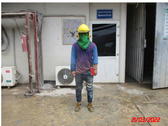
พนักงานของโครงการ คนที่ 1