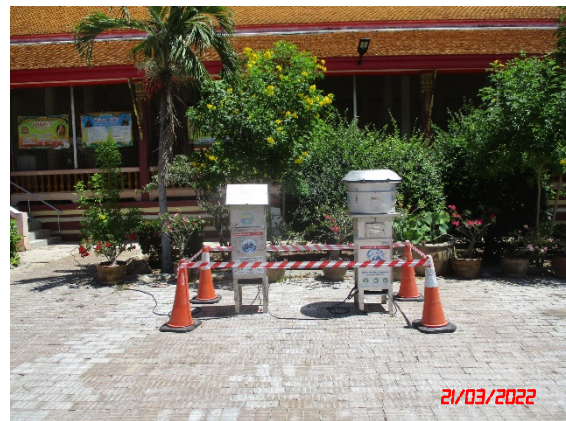
บ้านท่านกเอี้ยง