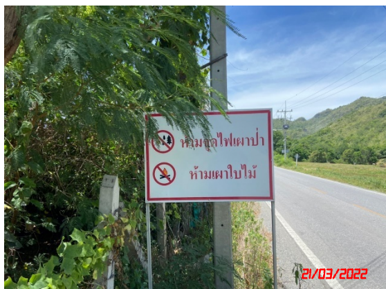
ป้ายเตือนห้ามจุดไฟเผาป่า