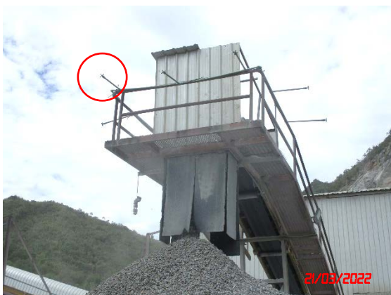
ระบบสเปรย์น้ำปลายสายพานลำเลียง