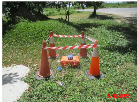
วัดบ้านถ้ำ