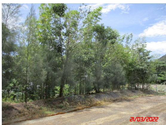
คั่นทำนบดิน