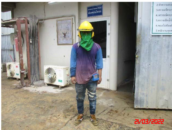
พนักงานของโครงการ คนที่ 1