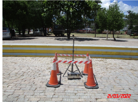
บ้านท่านกเอี้ยง