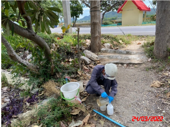
บ่อบาดาลบ้านถ้ำ