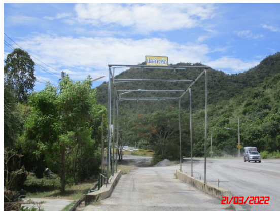
รูปที่ 2-11 การปิดคลุมผ้าใบรถบรรทุก