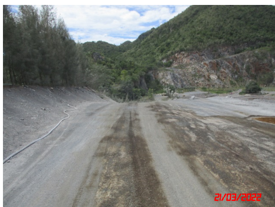
รูปที่ 2-18 เส้นทางขนส่งแร่