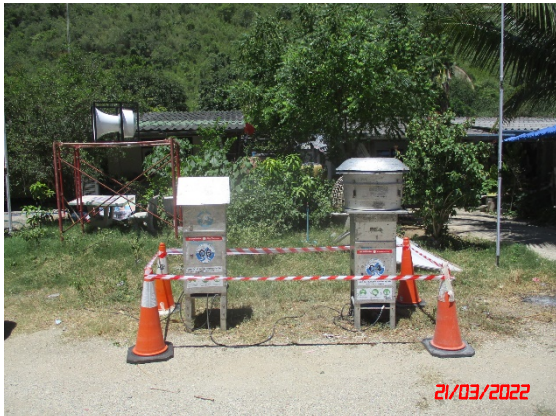
บ้านหลังที่ไกลสุดด้านทิศเหนือ