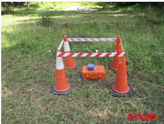
บ้านหลังที่ใกล้สุดด้านทิศเหนือ